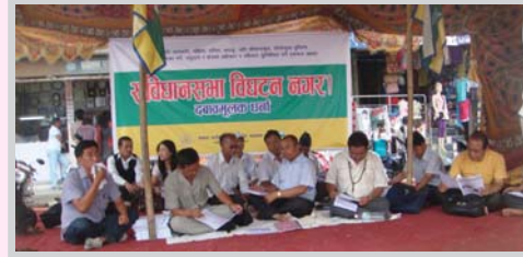
'जातीय स्वशासन सहितको स्वायत्तता र आत्मनिर्णयको अधिकार, संघीय लोकतान्त्रिक गणतन्त्र नेपाल निर्माणको मूल आधार'

सम्माननीय संविधानसभाका अध्यक्षज्यू सभा अध्यक्षको कार्यालय सिंहदरवार, काठमाडौं